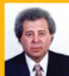
Μνήμη Άκην Μελετιού

Υπό την αιγίδα του έντιμου Υπουργού Εσωτερικών κ. Κωνσταντίνου Πετρίδη